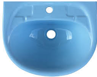
อ่างล้างหน้าแบบแขวนผนัง รุ่น "เม็มกรี"