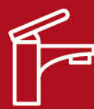
ก๊อกน้ำและวาล์ว FAUCET AND VALVE

เติมเต็มความสะดวกสบายและดีไซน์ที่สมบูรณ์แบบให้กับห้องน้ำด้วยรูปลักษณ์ที่ทันสมัย และวัสดุคุณภาพเยี่ยม