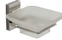
ที่ใส่สบู่ รหัสสินค้า : 05012370 สี : โครเมียม