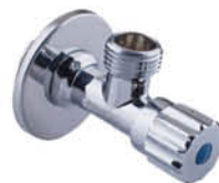
วาล์วเปิด-ปิดน้ำ แบบเข้า 1 ออก 1 รหัสสินค้า : 04016436