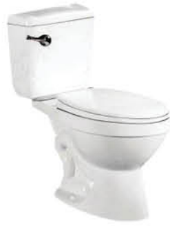
ชักโครกแบบสองชั้น รุ่น "แคนาดา"