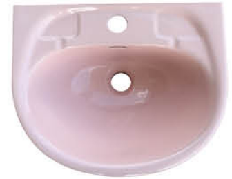
อ่างล้างหน้าแบบแขวนผนัง รุ่น "เม็มชิกส์"