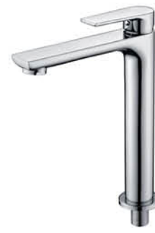
ก๊อกเดี่ยวอ่างล้างหน้าทรงสูง