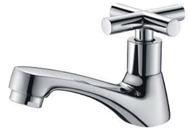
ก๊อกเดี่ยวอ่างล้างหน้า