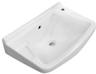
อ่างล้างหน้าแบบแขวนผนัง รุ่น "วูฟ"