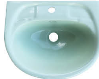
อ่างล้างหน้าแบบแขวนผนัง รุ่น "เม็มฟอร์"