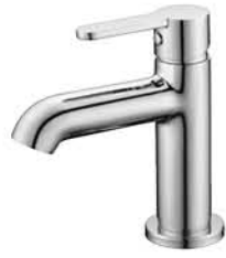
ก๊อกเดี่ยวอ่างล้างหน้า