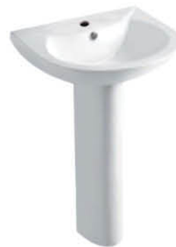
อ่างล้างหน้าพร้อมชายาว รุ่น "มูน"