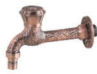
ก๊อกสนามก้านยาว แบบลวดลาย