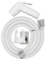
ชุดฉีดชำระพร้อมสาย และขอแขวน รหัสสินค้า : 05012806 สี : ขาว

รหัสสินค้า : 05008454 ขนาด : 14 นิ้ว รหัสสินค้า : 05008455 ขนาด : 16 นิ้ว รหัสสินค้า : 05008456 ขนาด : 18 นิ้ว รหัสสินค้า : 05008457 ขนาด : 20 นิ้ว