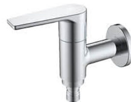
ก๊อกล้างพื้น