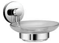
ที่ใส่สบู่ รหัสสินค้า : 05012375 สี : โครเมียม