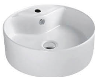
อ่างล้างหน้าวางบนเคาน์เตอร์ รุ่น "โมมิ"