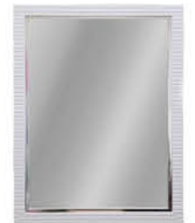
กระจกแบบมีกรอบ ติดผนัง รหัสสินค้า : 13002384 ขนาด : 53x68 ซม. รหัสสินค้า : 13002389 ขนาด : 60x80 ซม.