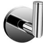
ขอแขวนผ้าเดี่ยว รหัสสินค้า : 05012379 สี : โครเมียม