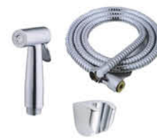
ชุดฉีดชำระพร้อมสาย และขอแขวน รหัสสินค้า : 05013045 สี : โครเมียม