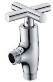
วาล์วลอยฝักบัว