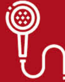
อุปกรณ์ห้องน้ำ FITTING

ผลิตจากวัสดุคุณภาพเยี่ยมเพื่อการใช้งานที่ยาวนาน โดยมีหลากหลายแบบ หลายดีไซน์เลือกสรรได้ตามความต้องการ