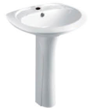
อ่างล้างหน้าพร้อมชายาว รุ่น "โมนี่"