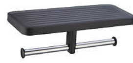
ชั้นวางของ พร้อมที่ใส่กระดาษ ทิชชู รหัสสินค้า : 05011728