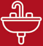
อ่างล้างหน้า WASH BASIN

ครบทุกรูปแบบและทุกความต้องการ อาทิ อ่างแขวนผนัง, อ่างมีขา หรืออ่างวางบนเคาน์เตอร์ คุณภาพสูง ดีไซน์สวย