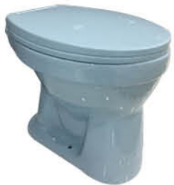
โถส้วมแบบนั่งราบ รุ่น "โลกบูล"