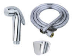
ชุดฉีดชำระพร้อมสาย และขอแขวน รหัสสินค้า : 05013046 สี : โครเมียม