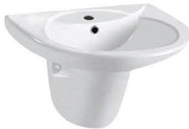
อ่างล้างหน้าพร้อมชาลีน รุ่น "เมน่า"