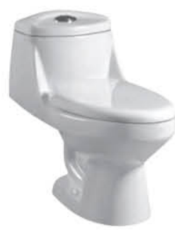
ชักโครกแบบชั้นเดียว รุ่น "เลกา"