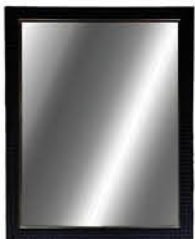
กระจกแบบมีกรอบ ติดผนัง รหัสสินค้า : 13002385 ขนาด : 53x68 ซม. รหัสสินค้า : 13002390 ขนาด : 60x80 ซม.