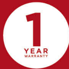
1 YEAR WARRANTY

หากพบปัญหาหรือข้อบกพร่องของสินค้าอันเกิดจากการผลิตภายใต้ระยะเวลาประกันสินค้า เราพร้อมส่งทีมช่างผู้เชี่ยวชาญไปแก้ไขปัญหาให้คุณถึงบ้าน โดยไม่มีค่าใช้จ่ายทั้งค่าอะไหล่และค่าบริการ หรือถ้าหากเกินระยะเวลาประกันสินค้า เราสามารถบริการซ่อมแซมให้ได้ในราคาย่อมเยา (เฉพาะในเขตกรุงเทพฯ และปริมณฑล)