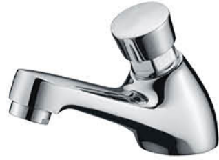
ก๊อกเดี่ยวอ่างล้างหน้าแบบกด