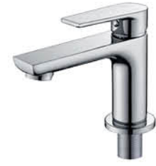
ก๊อกเดี่ยวอ่างล้างหน้า