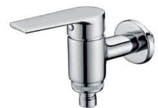
ก๊อกล้างพื้น