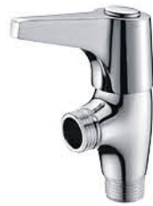
วาล์วลอยฝักบัว