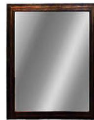
กระจกแบบมีกรอบ ติดผนัง รหัสสินค้า : 13002383 ขนาด : 53x68 ซม. รหัสสินค้า : 13002388 ขนาด : 60x80 ซม.