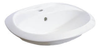
อ่างล้างหน้าแบบแขวนผนัง รุ่น "บีบี"