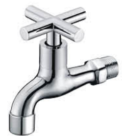
ก๊อกล้างพื้น