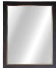
กระจกแบบมีกรอบ ติดผนัง รหัสสินค้า : 13002386 ขนาด : 53x68 ซม. รหัสสินค้า : 13002391 ขนาด : 60x80 ซม.