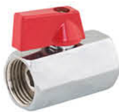
วาล์วเปิด-ปิดน้ำ ข้อต่อตรงเกลียวใน รหัสสินค้า : 04009415 สี : โครเมียม