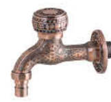
ก๊อกสนามก้านยาว แบบลวดลาย