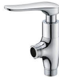
วาล์วลอยฝักบัว