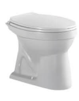
โถส้วมแบบนั่งราบ รุ่น "มินา"