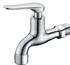
ก๊อกล้างพื้น