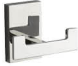
ขอแขวนผ้าคู่ รหัสสินค้า : 05012368 สี : โครเมียม