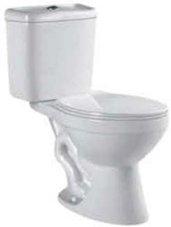
ชักโครกแบบสองชั้น รุ่น "เนม"