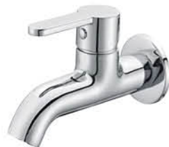
ก๊อกล้างพื้น