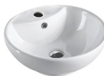
อ่างล้างหน้าวางบนเคาน์เตอร์ รุ่น "เนกา"