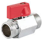
วาล์วเปิด-ปิดน้ำ ข้อต่อตรงเกลียวนอก รหัสสินค้า : 04009441 สี : โครเมียม