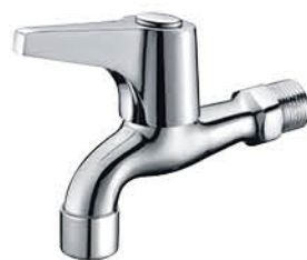
ก๊อกล้างพื้น