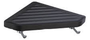
ชั้นวางของ พร้อมขอแขวน รหัสสินค้า : 05011729