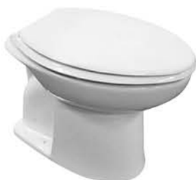
โถส้วมแบบนั่งราบ รุ่น "โรฮาน"