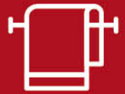
อุปกรณ์ตกแต่งห้องน้ำ ACCESSORIES

พร้อมสรรพด้วยสายฉีดชำระฝักบัว ตะแกรงกันกลิ่น สะดือ ก่อน้ำทิ้ง สายน้ำดีโยนแก้ว เพื่อการใช้งานที่สมบูรณ์แบบ