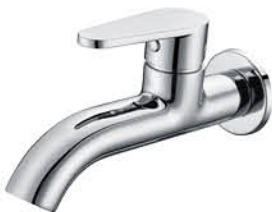
ก๊อกล้างพื้น