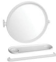
กระจกติดผนัง +ราวแขวนผ้า +ชั้นวางของ รหัสสินค้า : 13002340 สี : ขาว