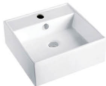
อ่างล้างหน้าวางบนเคาน์เตอร์ รุ่น "เนก"