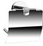
ที่ใส่กระดาษทิชชู แบบมีฝาดปิด รหัสสินค้า : 05012373 สี : โครเมียม