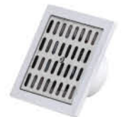
ตะแกรงระบายน้ำ ฝาครอบสแตนเลส รหัสสินค้า : 05011843