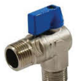
วาล์วเปิด-ปิดน้ำ ข้องอ 90 องศาเกลียวนอก รหัสสินค้า : 04009419 สี : โครเมียม