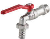
ก๊อกสนาม