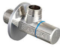
วาล์วเปิด-ปิดน้ำ แบบเข้า 1 ออก 1 รหัสสินค้า : 04016435