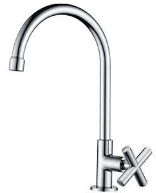
ก๊อกซิงค์ล้างจาน