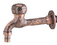
ก๊อกสนามก้านยาว แบบลวดลาย