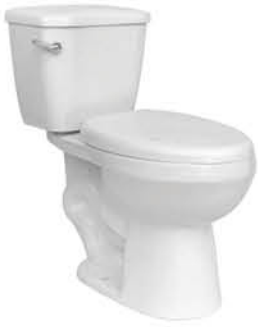
ชักโครกแบบสองชั้น รุ่น "นานา"