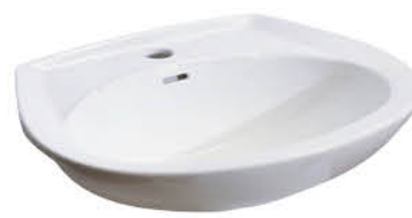
อ่างล้างหน้าแบบแขวนผนัง รุ่น "วี"