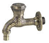
ก๊อกสนามก้านยาว แบบลวดลาย