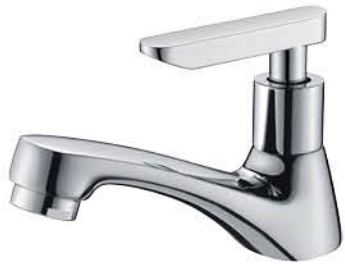
ก๊อกเดี่ยวอ่างล้างหน้า