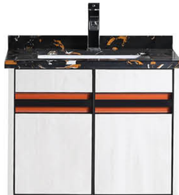
ตู้พร้อมอ่างและตู้กระจก 60x50x52 ซม.