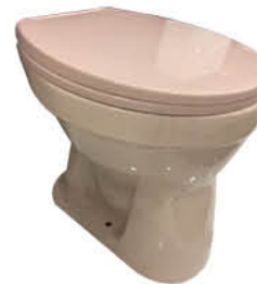
โถส้วมแบบนั่งราบ รุ่น "พองค์"