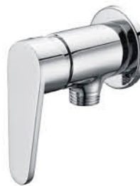
วาล์วลอยฝักบัว