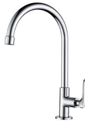
ก๊อกซิงค์ล้างจาน