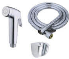
ชุดฉีดชำระพร้อมสาย และขอแขวน รหัสสินค้า : 05013047 สี : โครเมียม