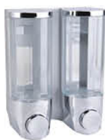
ที่กดสบู่เหลว แบบติดผนัง รหัสสินค้า : 05013241 สี : โครเมียม