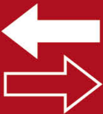
บริการหลังการขาย

หากพบปัญหาหรือข้อบกพร่องของสินค้าอันเกิดจากการผลิตภายใต้ระยะเวลาประกันสินค้า เราพร้อมส่งทีมช่างผู้เชี่ยวชาญไปแก้ไขปัญหาให้คุณถึงบ้าน โดยไม่มีค่าใช้จ่ายทั้งค่าอะไหล่และค่าบริการ หรือถ้าหากเกินระยะเวลาประกันสินค้า เราสามารถบริการซ่อมแซมให้ได้ในราคาย่อมเยา (เฉพาะในเขตกรุงเทพฯ และปริมณฑล)