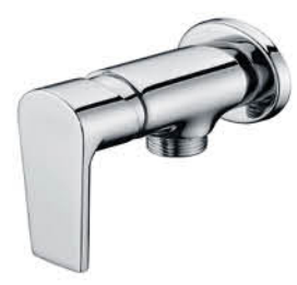
วาล์วลอยฝักบัว