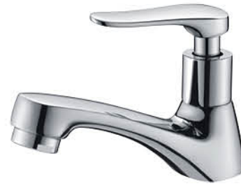
ก๊อกเดี่ยวอ่างล้างหน้า