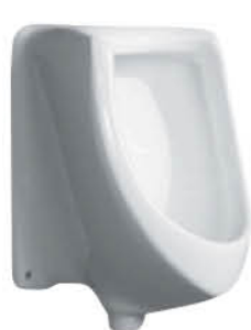
โถปัสสาวะชาย รุ่น "เพน"