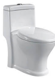
ชักโครกแบบชั้นเดียว รุ่น "เลกา"