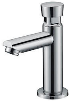
ก๊อกเดี่ยวอ่างล้างหน้าแบบกด