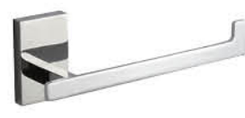
ที่ใส่กระดาษทิชชูไม่มี ฝาดปิด รหัสสินค้า : 05012369 สี : โครเมียม