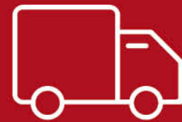
บริการจัดส่งสินค้า

เรารับประกันสินค้า 1 ปี สำหรับโถสุขภัณฑ์ โถปัสสาวะ และอ่างล้างหน้า รวมถึงก๊อกน้ำ และอุปกรณ์ห้องน้ำ ซึ่งครอบคลุมเฉพาะสินค้าที่พบปัญหาข้อบกพร่องจากการผลิตเท่านั้น โดยบริษัทฯ จะดำเนินการซ่อมแซมหรือเปลี่ยนเป็นสินค้าที่เทียบเท่า โดยไม่คิดมูลค่าอะไหล่หรือตัวสินค้า ตามเงื่อนไขที่บริษัทฯ กำหนด