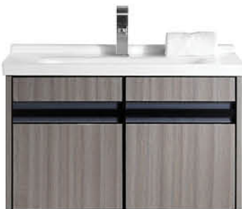
ตู้พร้อมอ่างและตู้กระจก 80x48x51 ซม.