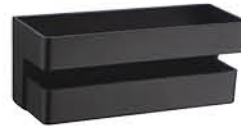
ชั้นวางของ รหัสสินค้า : 05011727