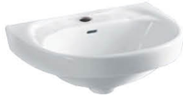
อ่างล้างหน้าแบบแขวนผนัง รุ่น "เม็มกู"