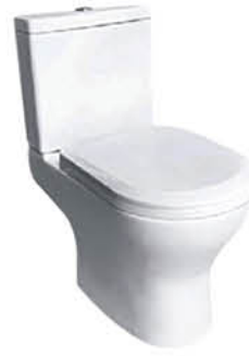
ชักโครกแบบสองชั้น รุ่น "มอนา"