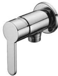
วาล์วลอยฝักบัว