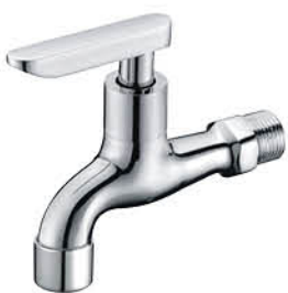
ก๊อกล้างพื้น