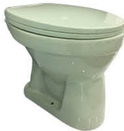
โถส้วมแบบนั่งราบ รุ่น "โลกกรีน"