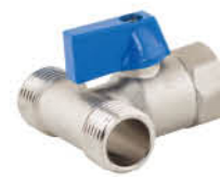
วาล์วเปิด-ปิดน้ำ ข้อสามทางเกลียวนอก-ใน รหัสสินค้า : 04009418 สี : โครเมียม