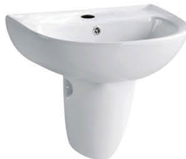
อ่างล้างหน้าพร้อมชาลีน รุ่น "เมมโม"