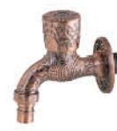
ก๊อกสนามก้านยาว แบบลวดลาย