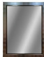
กระจกแบบมีกรอบ ติดผนัง รหัสสินค้า : 13002387 ขนาด : 53x68 ซม. รหัสสินค้า : 13002392 ขนาด : 60x80 ซม.