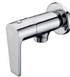
วาล์วลอยฝักบัว