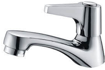
ก๊อกเดี่ยวอ่างล้างหน้า