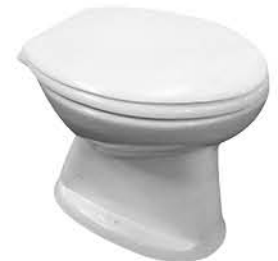
โถส้วมแบบนั่งราบ รุ่น "ออมเบอร์"