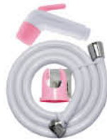
ชุดฉีดชำระพร้อมสาย และขอแขวน รหัสสินค้า : 05012808 สี : ขาว-ชมพู