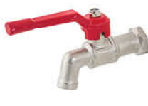
ก๊อกสนาม