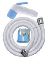
ชุดฉีดชำระพร้อมสาย และขอแขวน รหัสสินค้า : 05012807 สี : ขาว-ฟ้า