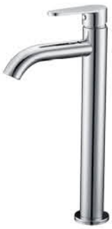
ก๊อกเดี่ยวอ่างล้างหน้าทรงสูง