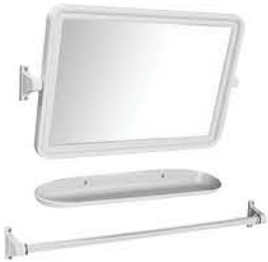
กระจกติดผนัง +ราวแขวนผ้า +ชั้นวางของ รหัสสินค้า : 13002339 สี : ขาว