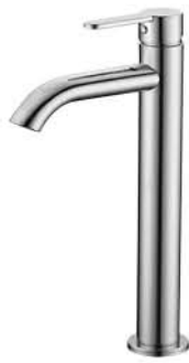
ก๊อกเดี่ยวอ่างล้างหน้าทรงสูง