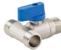
วาล์วเปิด-ปิดน้ำ ข้อสามทางเกลียวนอก รหัสสินค้า : 04009417 สี : โครเมียม