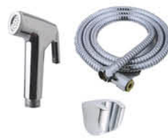
ชุดฉีดชำระพร้อมสาย และขอแขวน รหัสสินค้า : 05013044 สี : โครเมียม