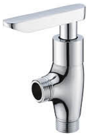
วาล์วลอยฝักบัว