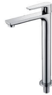
ก๊อกเดี่ยวอ่างล้างหน้าทรงสูง