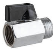
วาล์วเปิด-ปิดน้ำ ข้อต่อตรงเกลียวนอก-ใน รหัสสินค้า : 04009416 สี : โครเมียม