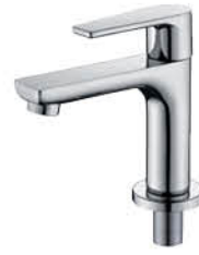
ก๊อกเดี่ยวอ่างล้างหน้า