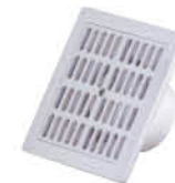
ตะแกรงระบายน้ำ ฝาครอบสีขาว รหัสสินค้า : 05012677 สี : ขาว