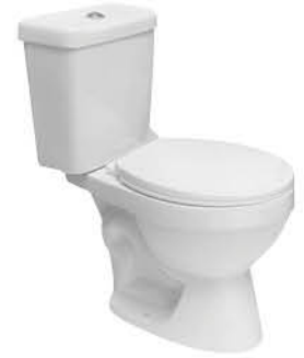
ชักโครกแบบสองชั้น รุ่น "มาด้า"