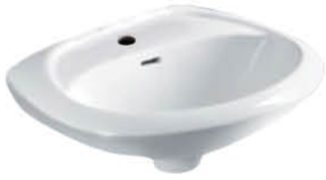
อ่างล้างหน้าแบบแขวนผนัง รุ่น "เม็มวัน"