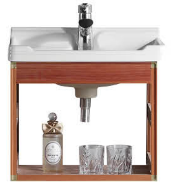
ตู้พร้อมอ่างและตู้กระจก 50x36x27 ซม.