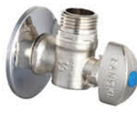
วาล์วเปิด-ปิดน้ำ แบบเข้า 1 ออก 1 รหัสสินค้า : 04016434