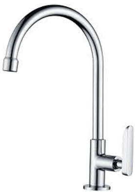
ก๊อกซิงค์ล้างจาน